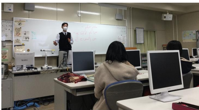
ウルドゥー語の歴史的、地理的な背景についての説明