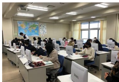
自分の名前をウルドゥー語で！