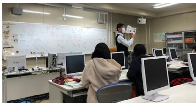
英語版の世界史教科書を使っでの説明